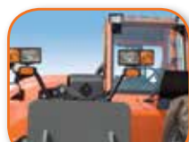
Luces para carretera