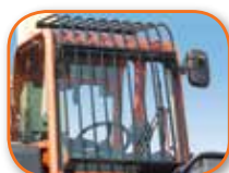
Rejilla de protección