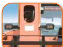
Luces de trabajo