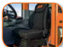
Asiento con suspensión neumática†