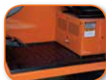
Tapete moldeado para el piso†