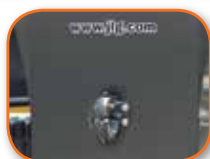
Gancho de pivote*