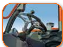
Columna de dirección inclinable†