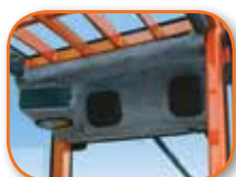
Kit para instalación de radio†