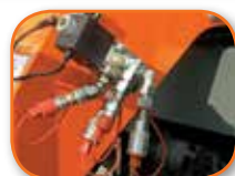
2ª hidráulica auxiliar†